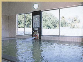
男性大浴場「なまはげの湯」