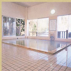
女性大浴場「なまはげの湯」

元湯とは、当館で所有する源泉の意。 神秘たどよう伝説の湖水が湯の源。 地中より湧出する神秘の郷湯は 季節天候で湯色を変えて 心と身を深くやさしくいやします。