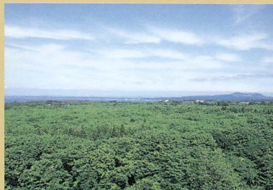
五風庵・客室からの眺望