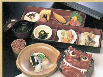
四季風春る御昼食「島風」