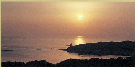
八望台から眺める美しい夕陽